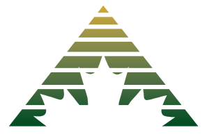
Community Futures Development Corporation Sociétés d'aide au développement des collectivités