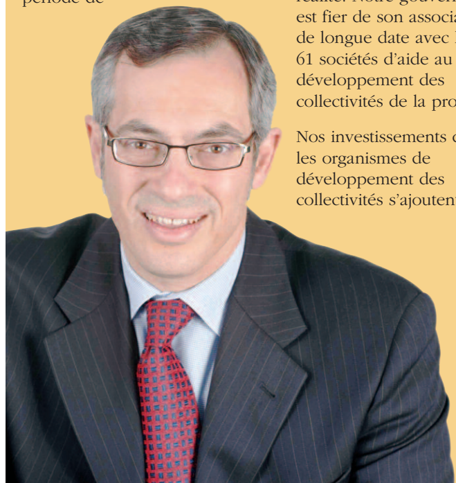
L'honorable Tony Clement Ministre de la Santé et ministre pour FedNor

Au nom du gouvernement du Canada, j'aimerais féliciter les bénévoles et les employés des sociétés d'aide au développement des collectivités pour leurs nombreux succès au cours de la dernière année et pour leur engagement décisif envers le développement des entreprises, la création d'emploi et la diversification économique.