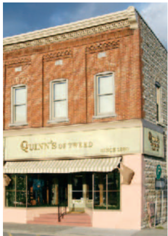
Revitalisation de la rue principale : Tweed

- Prix de développement économique communautaire 2008